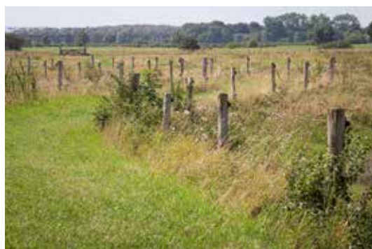
De struiner wordt tamelijk directief door de Rijswaard geleid, tussen twee hekken door.