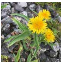
Engelse Alant op de langsdam bij Opijnen.

Misschien zie je wel zeldzame soorten als riempjes, slijkgroen en postelein.