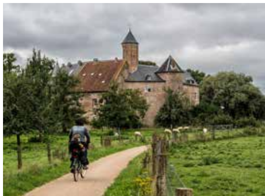
Het mysterieuze Kasteel Waardenburg.

Dwars door het bos kom je weer terug bij de dijk, om zo de terugweg te aanvaarden. Die gaat weer