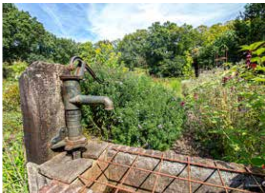
De weelderig begroeide Kasteeltuin van Neerijnen.