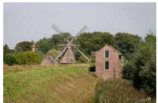
In één shot gevangen: kasteel Waardenburg, de korenmolen en het dijkmagazijn (vlnr).

Bij Café Neerijnen (dat niet meer wordt uitgebaat) duiken we de uiterwaarden weer in: de Rijswaard. Met een grote diversiteit aan wilde planten is de Rijswaard één van de meest waardevolle uiterwaarden in ons land. In het voorjaar en de zomer bloeien de wilde kruiden hier uitbundig. De zeldzame kwartelkoning zou hier broeden, maar volgens waarneming.nl is die hier voor het laatst in 2012 aangetroffen. Uiteraard vind je 's winters wel grote groepen ganzen en eenden. Volg hier het wandelpad. Je kunt niet anders, niet overal is de uiterwaard toegankelijk. Vlakbij de dijk is een klein monumentje voor gevallen veteranen, "dank aan hen die streden" staat erop. Het is geplaatst door Stichting Beeld van Oranje Linten, met steun van de Amerikaanse zakenman Leo Ullman.