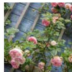
Rozen in de Kasteeltuin.

Een boeiende route die vanwege de veranderingen in het gebied interessant is om vaker te lopen. Het zal elk jaar iets anders zijn!